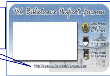
TESSERA DEL POLO