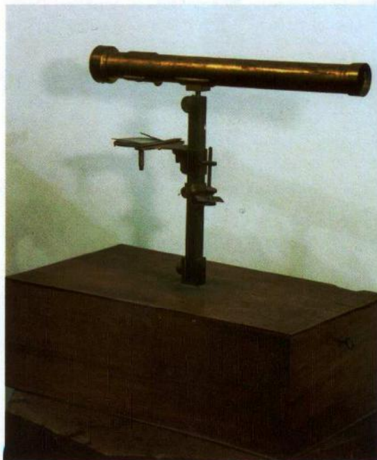
Fig. 3. Microscopio di Amici. Materiali: ottone, vetro, legno. Data di costruzione: sconosciuta. Presente nell'inventario 1929.

Tra i professori che ricoprirono per primi questo incarico è interessante la figura del prof. Giuseppe Bongiovanni (1851-1918) ottimo docente e scienziato, noto a livello nazionale per i suoi studi sull'elettromagnetismo. Sue sono varie presentazioni ai Congressi della Società Italiana di Fisica di fine '800, che trattano della «determinazione didattica» di fenomeni ma-