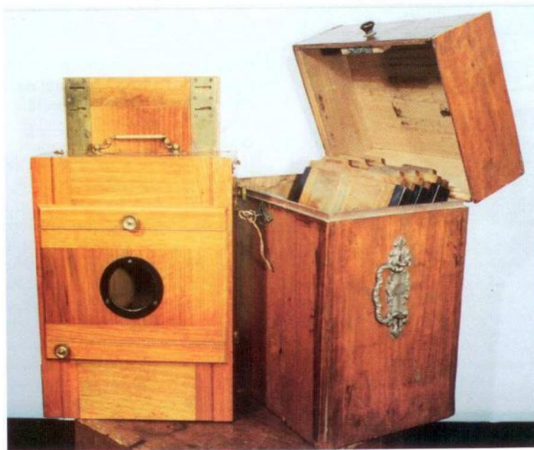
Fig. 6. Macchina fotografica con cassetta; data di costruzione: fine '800 - inizi '900; materiali: legno, cartone, vetro.