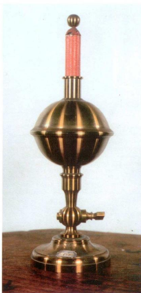
Fig. 1. Apparato di Faraday per lo studio dei dielettrici; non firmato, costruito in ottone e cera, 2ª metà secolo XIX.