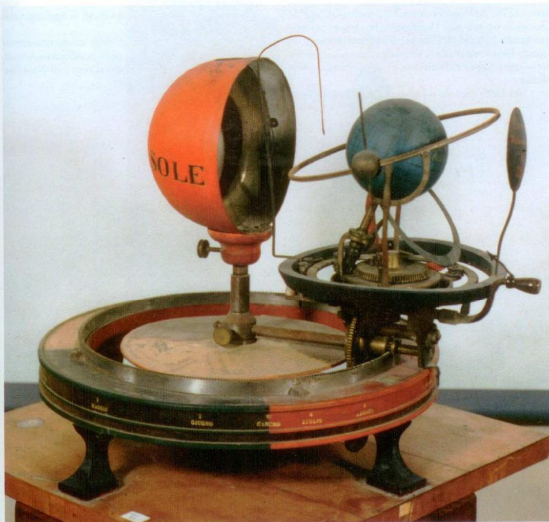
Fig. 4. Tellurio, inizi del XIX secolo circa.